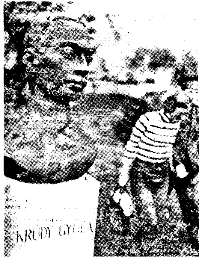
Krúdy sóstói szobra