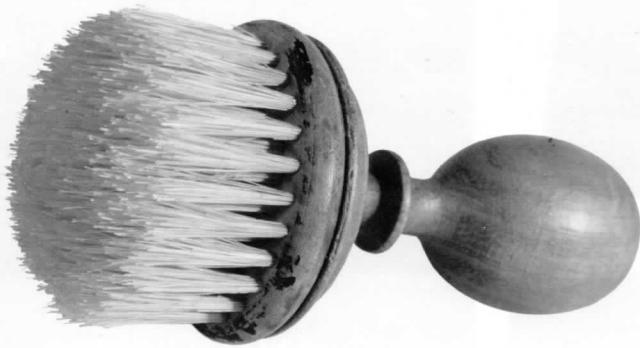
Krúdy Gyula borotvapamacsja (PIM)