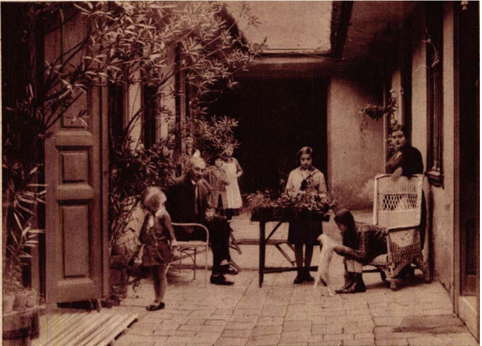
... kapualja, oleanderes, virágos udvar ..."