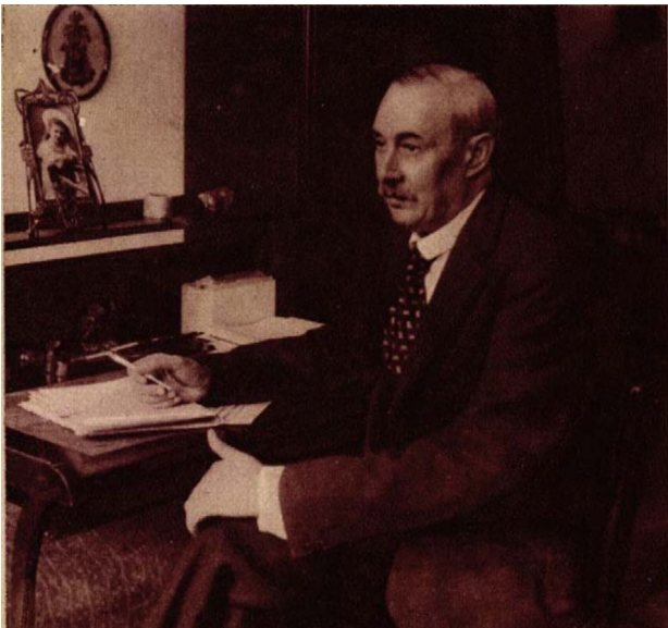
A megtért Krúdy

A zabolátlan, szilaj évtizedek után itt pihen meg, most először, a műsáknak ez a megfélekezhetetlen fia. Boldog öröm látni a „megtért“ Krúdy Gyulát, aki egy éjszaka ötször is felkel, megnézni, nem csúszott-e le a takaró kislányáról.