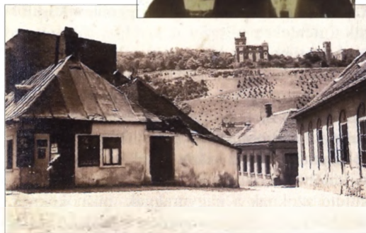
FOTÓ: SZENTKERESY 1910-ES ÉVEK

voltak 1918-tól 1931-ig a híres vendégei, majd a következő oldaltól írtak, rajzoltak bele barátai, vendégei. Krúdy Gyula az alábbiakat jegyezte bele: „Bizonyítvány. Ezennel bizonyítom, hogy Krausz Poldi Mély Pincéhez címzett vendéglőjében életem szép napjait és éjszakáit töltöttem. Krúdy Gyula, 1931. május 21.”