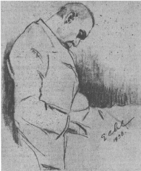
Dokumentum: Géhl Zoltán: „Az alvó Krúdy.” Közölve: Magyarország, 1933/115. (május 21.) 7. oldal.

Közölve: Világ, 1947. szeptember 14. 686. szám, 4. old. 6