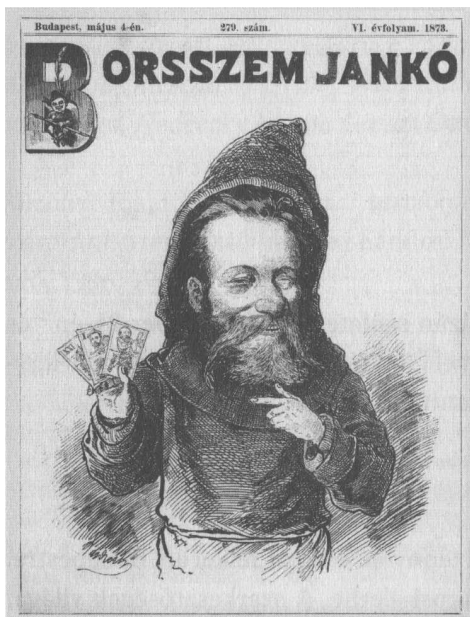
Dokumentum: A Borszem Jankó „kártyás” száma. 1873. május 4. VI. évfolyam, 279. szám, borítókép.

követni a kártya titkos érverését. Fölötte ült a kártyának, mint a felhő. Nyomasztotta a partnert, fenyegette sötét nyugalma. A pénz mégiscsak nagy dolog lehet, hogy azért annyian akadtak, akik nyerni mertek tőle. 25