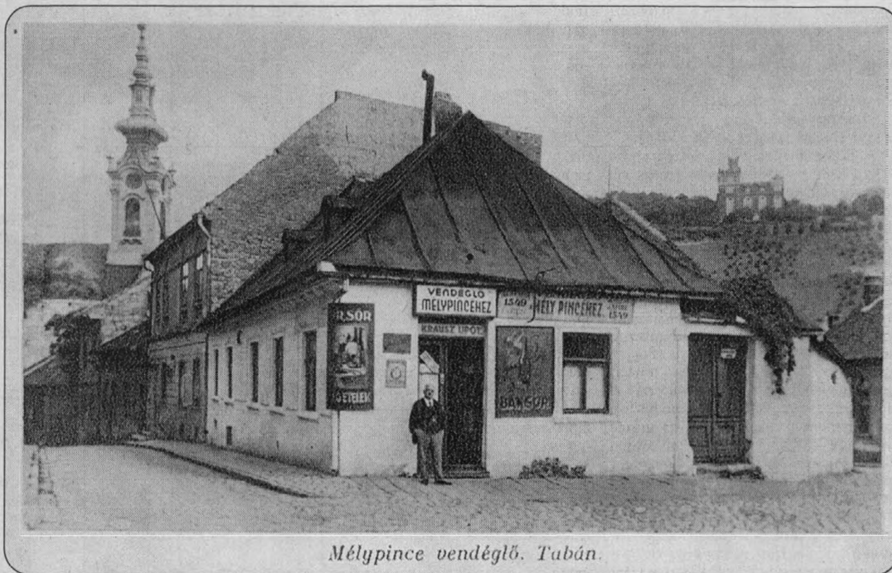
Mélypince vendéglő. Tabán.