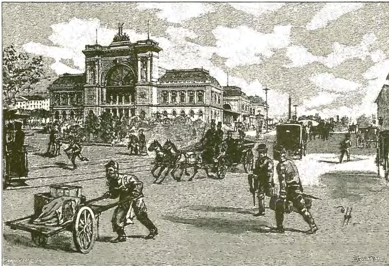
A keleti pályaudvar.

Noha az idő a Burgban is eleve más ritmus szerint pereg, mint a külső életben (a császár erre külön gondot fordít: hiszen sem a gázt, sem a villamos berendezéseket nem engedi be az épületbe), a szolgálattevők seregével (akik vidéki kisvárosra emlékeztető pletykafészkek te-