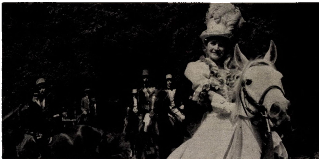
Pitti Katalin, a háttérben Mácsai Pál, Hirtling István és Szolnoki Tibor

Haumann Péter formálja, Szigligeti Józsefet Vajda László. Nyilvánvaló, hogy ők ketten nem énekelnek, rájuk prózai szerep hárul.