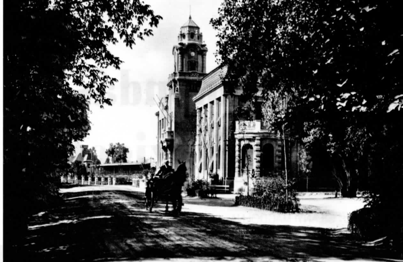
Szent Margitsziget Gyógyfürdő Rt. irodaháza