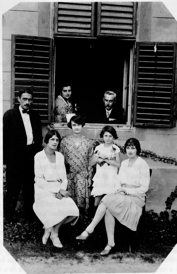
Krúdy Gyula családjával a Margitszigeten (ifj. Krúdy Gyula, Krúdy Ilona, ifj. Krúdy Gyuláné, Krúdy Zsuzsa, Krúdy Mária, Krúdy Gyuláné, Krúdy Gyula) 1928 (PIM)

Zárásul idézzük fel, hogy Krúdy Gyula nem csupán az általa szerkesztett Szigeti Séták számaiban emlékezett meg szűkebb pátriájának történelméről, nemcsak műveiben jelenítette meg, de gyakorlatban is foglalkoztatta a Margitsziget emlékeinek megőrzése, amit egy margitszigeti múzeum létesítésével képzelt el; egészen konkrét tervei ismertek a Fővárosi Közmunkák Tanácsához benyújtott felvetéséből, ötletei akár ma is aktuálisak lehetnek.