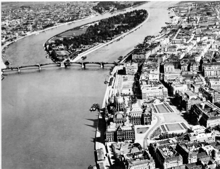
Légifotó Budapestről, 1933

Krúdy Gyula: Vallomás = Krúdy Zsuzsa: Apám, Szindbád , 101–106, 103.