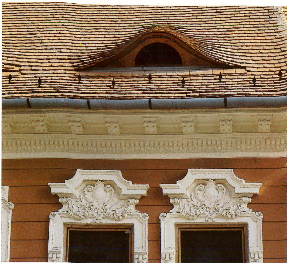
Óbuda, Templom utca 15., az író utolsó otthona

bemutató előadására. De máshová nem jártak együtt. Nagy esemény volt, amikor Magyarai Imre cigányprímás esküvőjén felesége társaságában jelent meg. Moziba talán soha életében nem ült be.