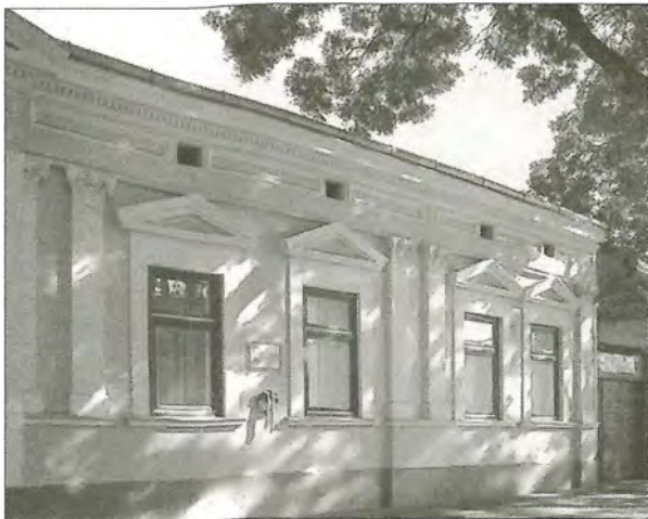
Krúdy Gyula szülőháza

A sétánkat folytassuk az egykori Kállói, ma Szent István utcában, ahol három Krúdyra vonatkozó emléktáblára is figyelmesek lehetünk. Az utca elején, a 8. sz. alatt található az az épület, ahol Krúdy 125 évvel ezelőtt meglátta a napvilágot. Itt 1963. május 12-én, az író halálának a 30. évfordulója alkalmából leplezték le azt a kőkeretbe foglalt márványtáblát, amelyen ez a híres idézet olvasható: „Ennek a városnak voltam az írója”.