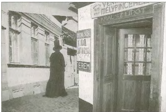
Részlet a Krúdy Gyula emlékkiállításból