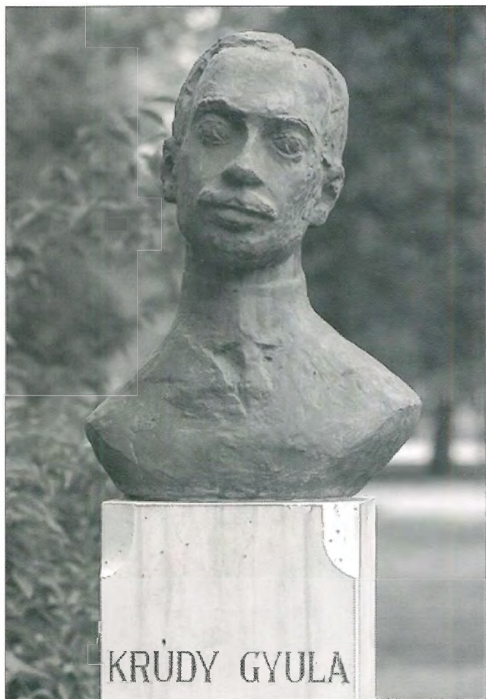
Mészáros Dezső: Krúdy Gyula