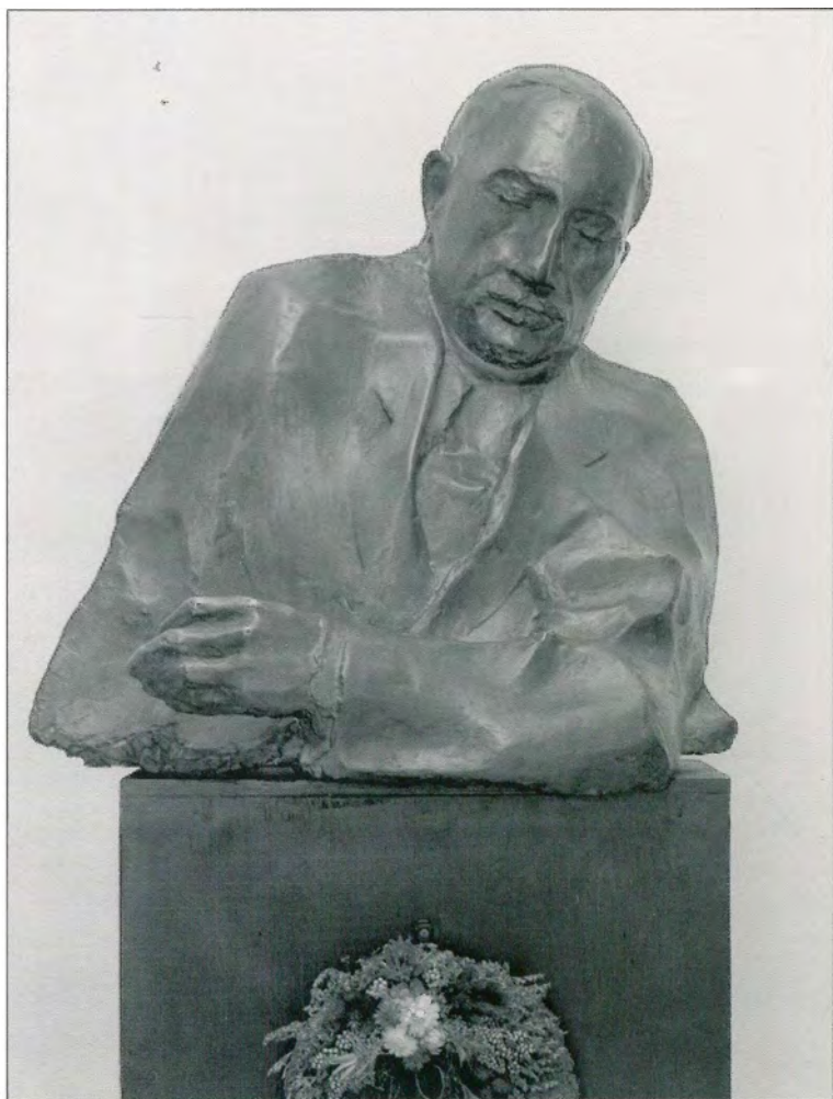
Borbás Tibor: Krúdy Gyula