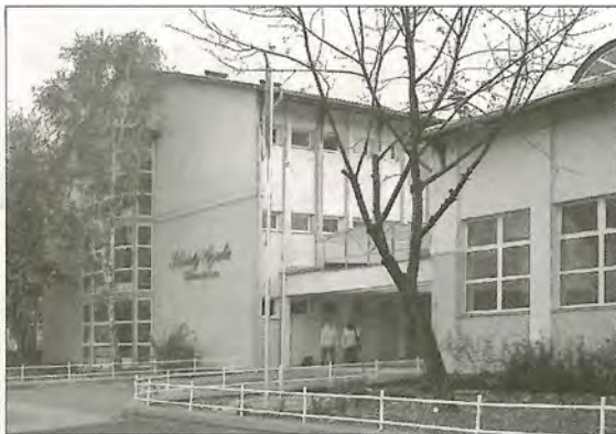
Krúdy Gyula Gimnázium