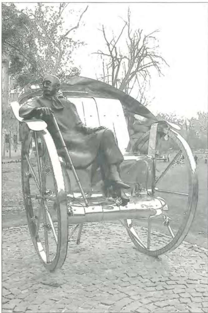
Varga Imre: Hazatérés (Krúdy Gyula emlékére)