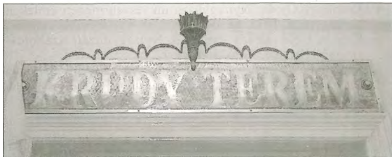
A Krúdy terem felirata a Városházán

2003. október 21-én a város képviselő-testülete ünnepi közgyűlést tartott Krúdy Gyula tiszteletére. Ekkor a Városháza dísztermét az ünnepelt íróról nevezték el.