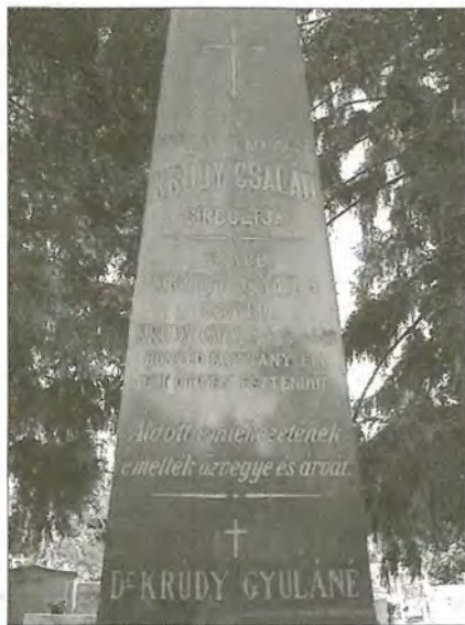
A Krúdy család síremléke

sóhajós leányszíveit, álmódzó asszonyait, borozó politikusait, gavallérjait a régi Sóstó kocs útjait és cigánymuzsikás mulatásait a Krúdy könyvek örökítik meg képekben, mozdulatokban, zeneiségben s az új Nyíregyháza az ő nevét örökíti meg, őt őrzi a halhatatlanság számára. Nyíregyháza példát adott az irodalmi értékek megbecsülésére, amikor Krúdyról utcát nevezett el”. 2