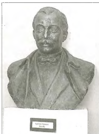
Gyenes Tamás: Krúdy Gyula