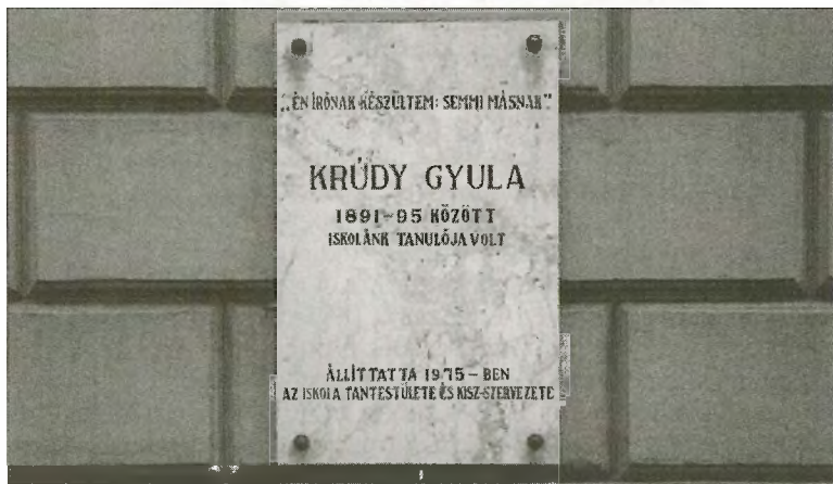
Emléktábla a Kossuth Gimnázium falán