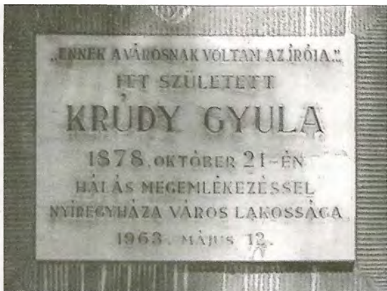
Emléktábla a Szent István utca 8. számú házon

Krúdy-emlékjelét 1949 tavaszán leplezték le. Akkor még azt hitték, hogy az író szülőházát jelölték meg, később azonban Katona Béla kutatásai tisztázták, hogy Krúdy itt csak a gyermek- és ifjúkorát töltötte, de nem ebben a házban született. A szülőház az előbb bemutatott épület volt, amelynek a falára 1963-ban helyezték el a márványtáblát. Az író portréjával ékesített, mészkőből faragott domborművet Koroknay Gyula, Nyíregyháza kiváló művészettörténésze így jellemezte: „Érdekes nézetével, a jellemábrázolás hűségével tűnik ki ez az emléktábla, van benne egy kis krúdy álmodozás, egy kis Berky-líraiság, könnyed és mély”. 4