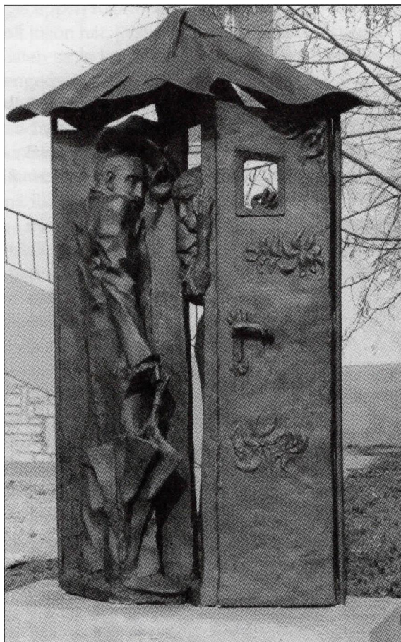
Borbás Tibor: Krúdy emlékére (bronz szobor, 190x130x30 cm). Várpalota Város Önkormányzata vásárolta a Képzőművészeti Lektorátus támogatásával. Avatása 1990. október 16-án, a Várpalotai Napok keretén belül történt