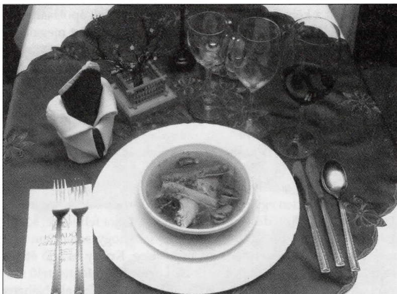
A Szindbád-vacsorák legnépszerűbb fogása az illatos húsleves, a Krúdy család receptje alapján