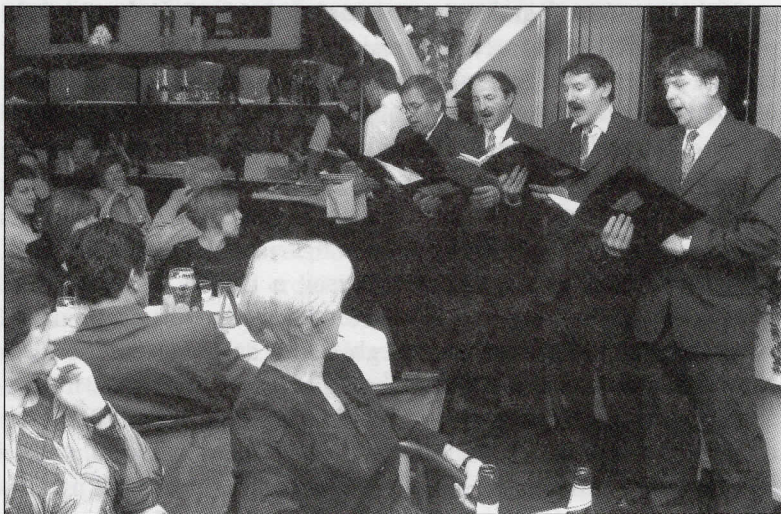
Szindbád hatodik vacsoráján a „Vox Krúdyliana” kamarakórus szervezte a „zenei körítést” 2004. február 6-án a Fogadó a Két Bagolyhoz éttermében