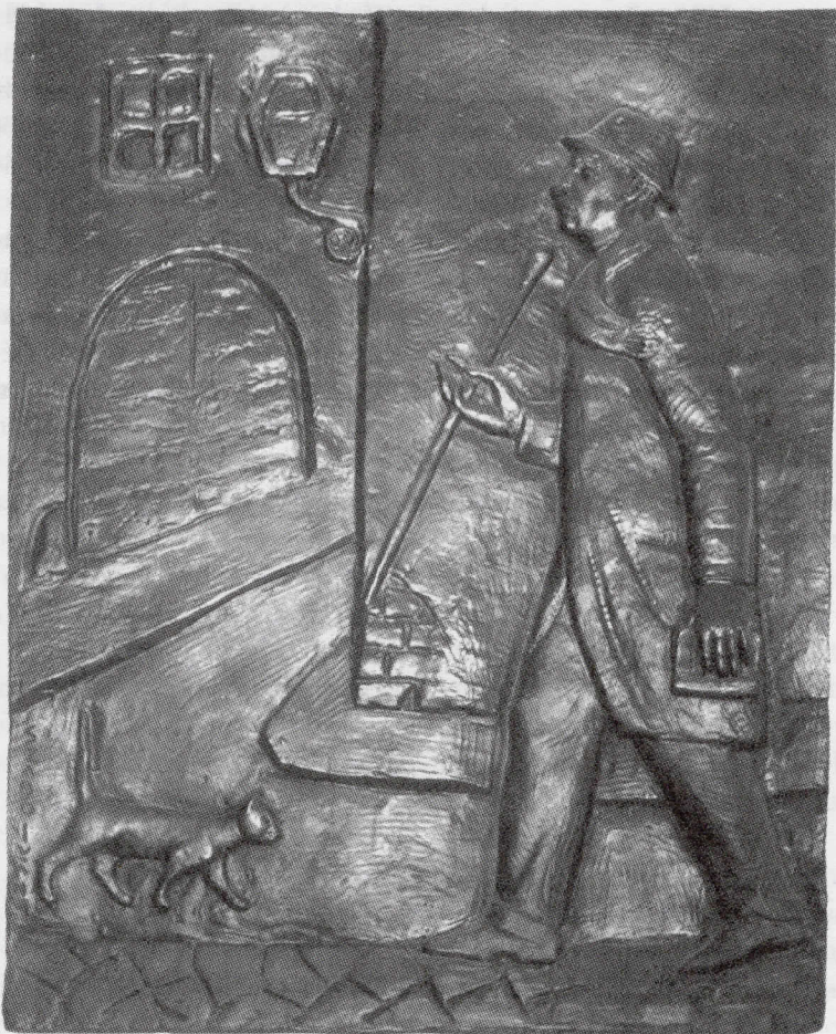
Szabó Iván: Szindbád (bronzrelief 60x80 cm). 1984 áprilisában került a könyvtár homlokzatára (Kossuth u. 2.). Az alkotás ma a könyvtár olvasótermében az internetes gépek felett látható