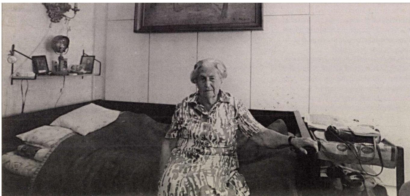
Krúdy sógor-nője: a boldogtalanság tamúja

– Eleinte nem látogattam őket, hiszen csak tizennégy éves voltam akkor. Így a