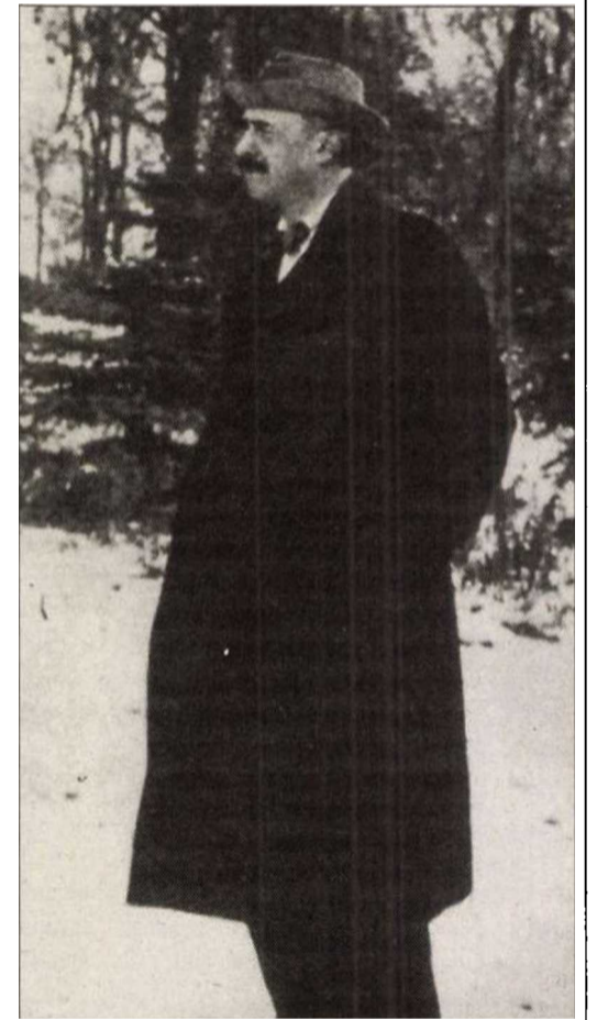
Krúdy Gyula a harmincas években

A Magyar Hírlap 1931. december 25-i számában már Óbuda jövője foglalkoztatta: „A harmadik terv volna a Nemzeti Stadion építése az Óbudai szigetre. Ez a sportolónak szentelt csodaéptítmény már csak azért is inkább tétetnek ide, mint a tervbe vett Ferencvárosba, mert hisz erre vezet a külföldre vivő bécsi út. Erre, Óbu-