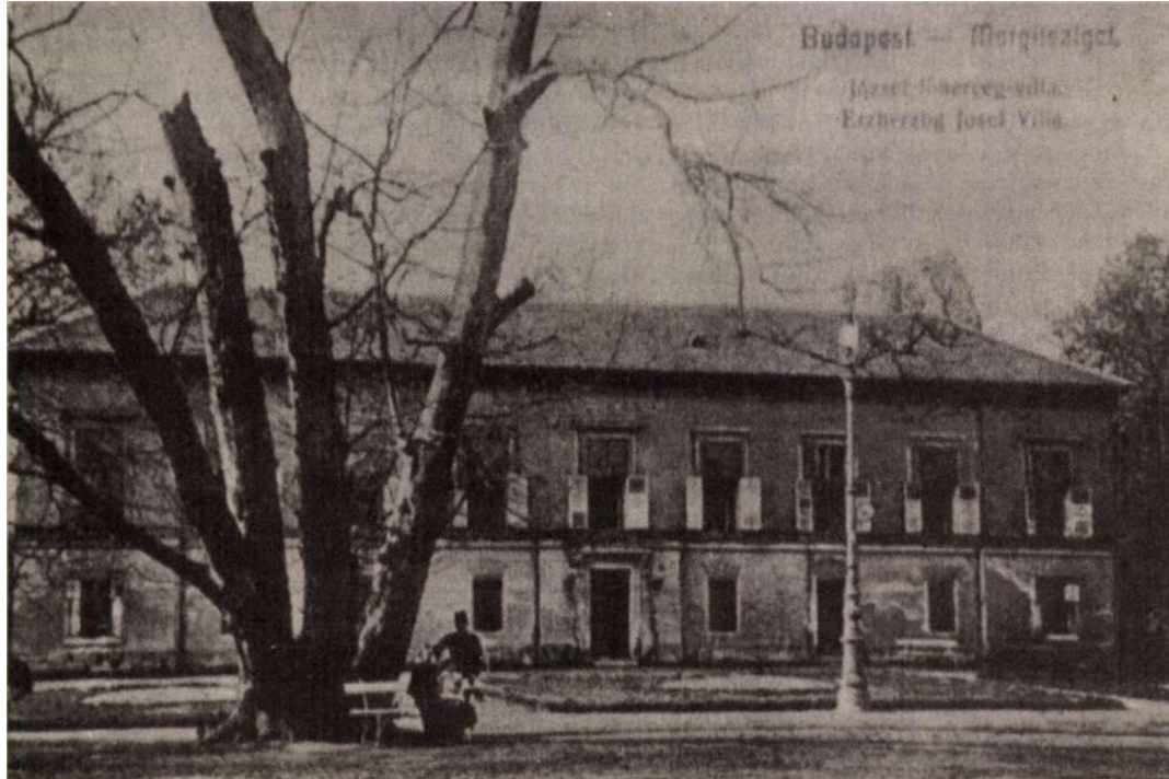
József főherceg-villa. A ház, amelyben Krúdy Gyula és családja lakott a Margitszigeten

A jó barát és kortárs, Hajós Alfréd főműve, a Nemzeti (ma Hajós Alfréd) Sportuszoda azon a helyen áll, ahol Krúdy magányos sétái során olyan gyakran megfordult. A véletlen azonban úgy hozta, hogy szinte abban az időben (1930 elején), amikor elkezdődtek az uszoda építési munkálatai, Krúdy családjával Óbudára költözött.