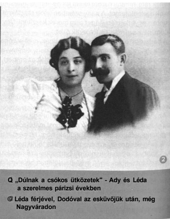
Q „Dúlnak a csókos ütközetek” - Ady és Léda a szerelmes párizsi években