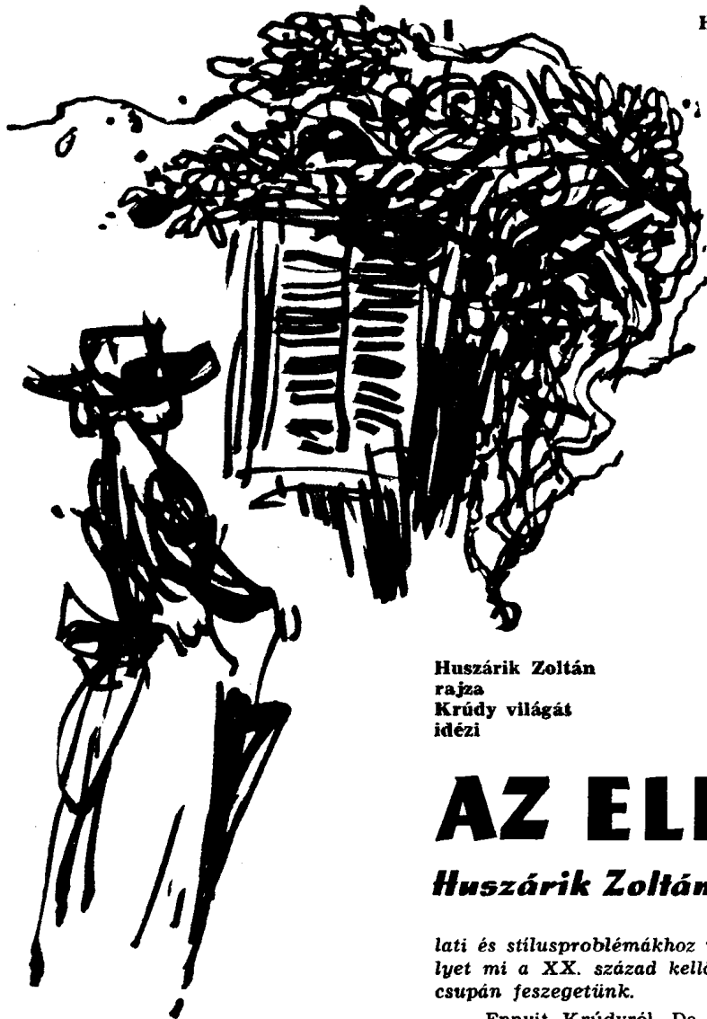
Huszárik Zoltán rajza Krúdy világát idézi