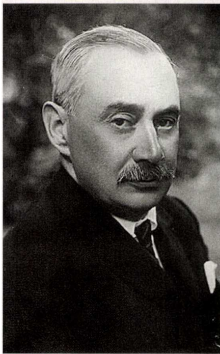
Vetélytársak: Krúdy és Pekár