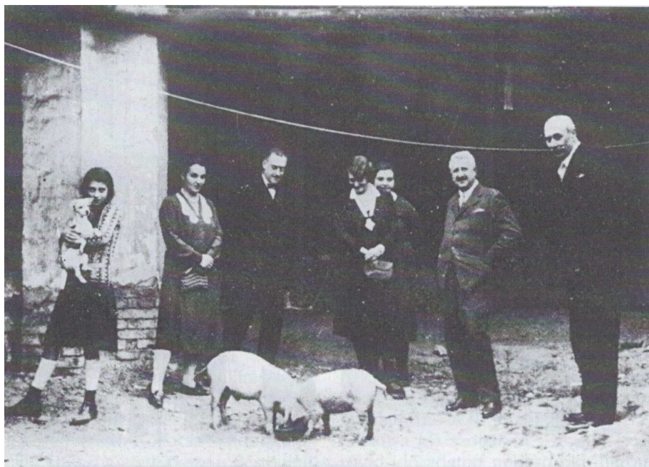
Krúdy Gyula vendégekkel óbudai lakásának udvarán

született kisregényéből valók például az alábbi idézetek: