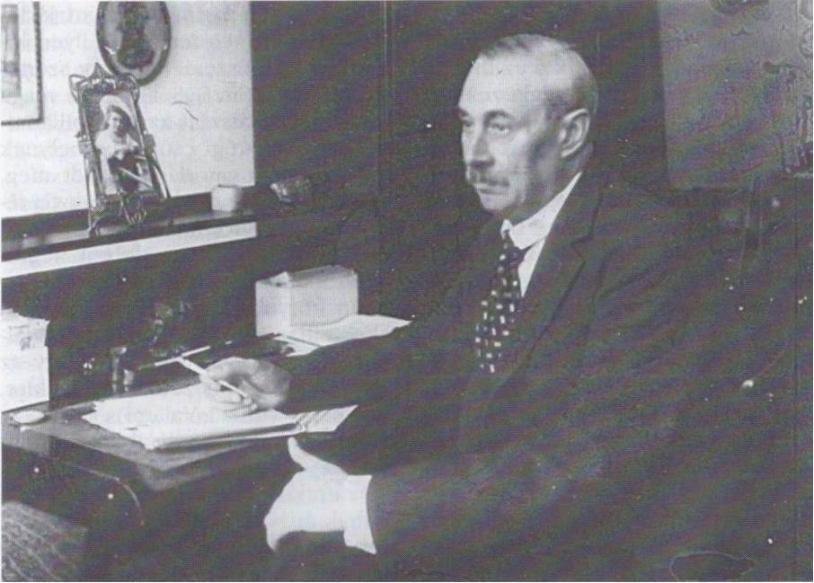
Krúdy Gyula íróasztalánál