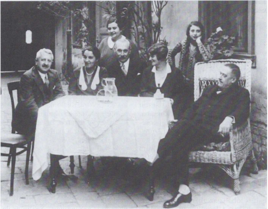
Krúdy Gyula óbudai (Templom utca 15.) otthona