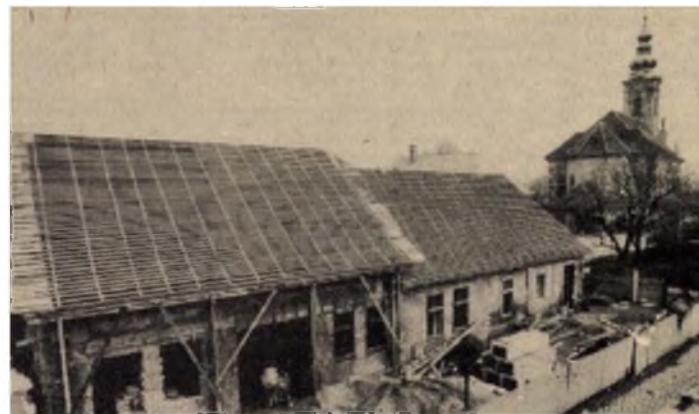
Kissé nyers még minden, de már kialakulóban a házak új arcúlatá

római kori oszloptöredékekig mindent tartalmaztak, összedőléssel fenyegetnek. A tetőszerkezet faanyagát is tönkreté a szu. Attól kellett félni, a munkások fejére rogy az egész ház. Nagy-