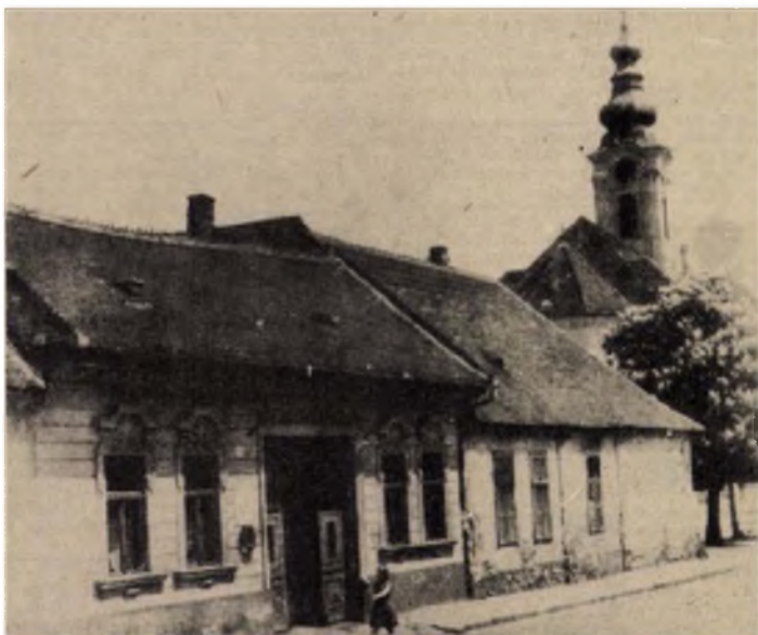
Ilyen volt 1958-ban, az emléktábla elhelyezésének évében a Dugonics tér 15. (kapuja mellett balról a megkoszorúzott márványtábla), s a 13-as szám. A háttérben a Szent Péter és Pál plébániatemplom