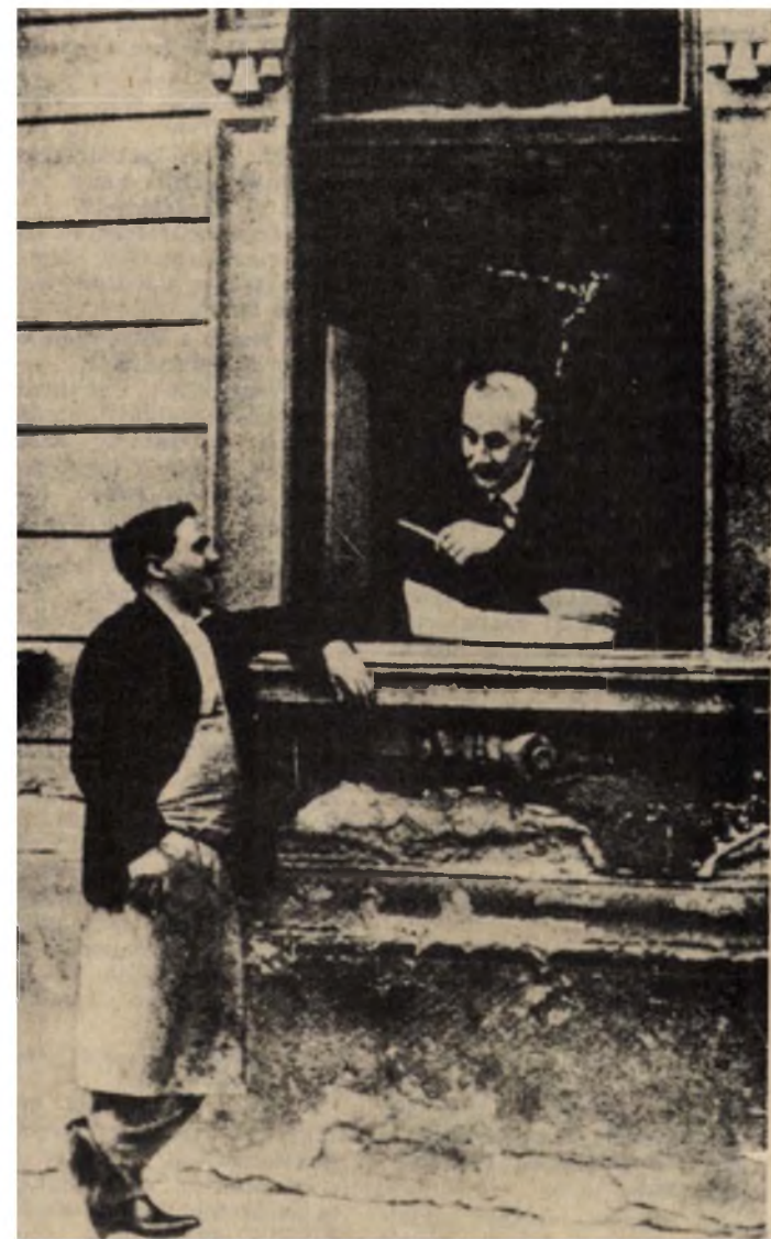
Régi felvétel a kapu melletti ablakban trécselő Krúdy Gyuláról

A tér — vagy inkább csak szélesebb utca — másik oldalán a három ház azonban izgalmasabb sorsot élt meg az utóbbi esztendőben.