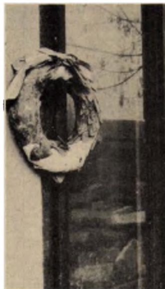
Az építők megőrizték a márványtábla utolsó, kissé romos koszorúját is

ket, de olyan funkciót kell adni nekik, amittől használhatók maradnak. Így alakult ki az elképzelés egy műemlékvédelmi komplexum létrehozásáról.