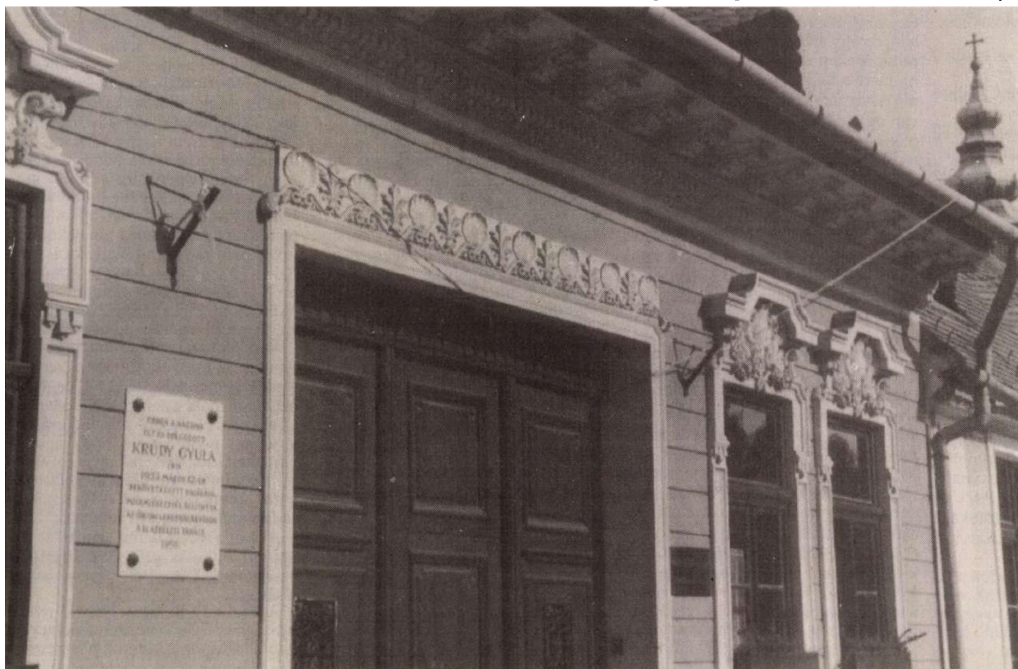
„A Templom utca 15. falán, balról, ott, ahol Krúdyék lakása volt, emléktábla”

Egy emléktábla s egy szobor. Ennyi őrizi Krúdy Gyula emlékét Óbudán. A hajótörött Szindbád örült, hogy kikötőre lett itt. A Krúdy-hívők is örülhetnek, hogy ennyi is megmaradt erre felé Szindbád lábnyomából.