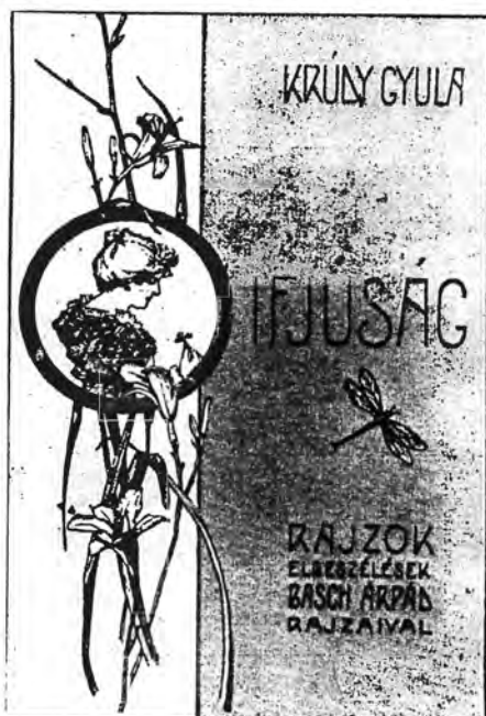
A pályanyitó könyv címlapja