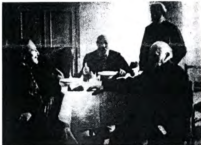
A nagypapa (baloldalt), menházi parancsnokként