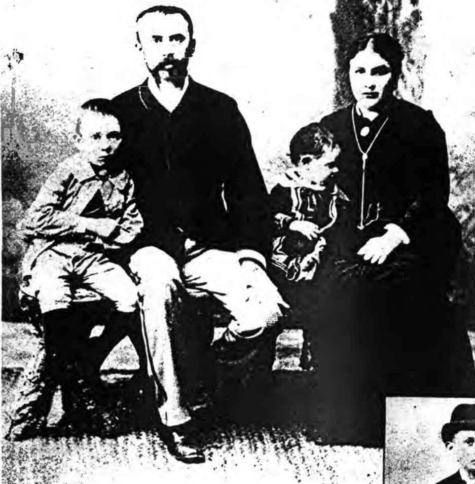
A család (a nagyobbik gyermek a későbbi író)

Ilyenkor is szeretem, mert ázsiai eredetünk, napkeletről jött, változékony kedvünk, búskomor magyar szomorúságunk tükröződött a holt vizekben és az emberi szemekben.