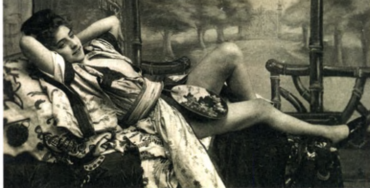
Luxuskéjné a múlt század elején

Erre gerjedtek a pasik – pornófelvétel anno