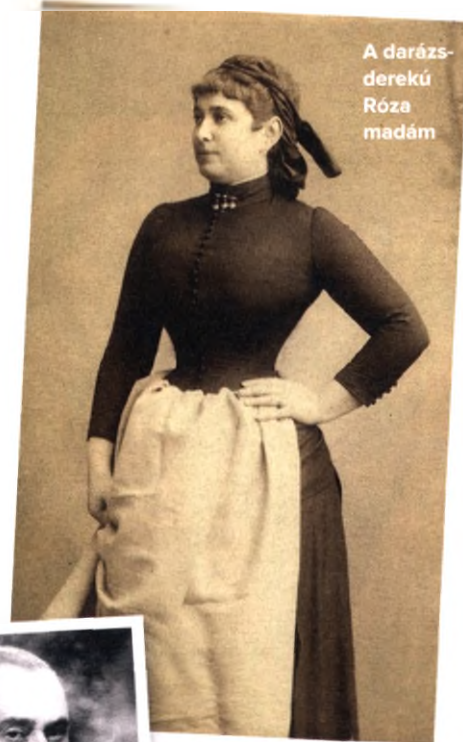
A darázderekú Róza madám

Róza nagyvilági eleganciával berendezett szalonjában egymásnak adták a kilincset befolyásos politikusok, fiatal grófok, öreg mágnások, valamint a főváros szellemi elitje. Leghíresebb szereője Andrássy Gyula gróf volt, az ország miniszterelnöke, de az Erzsébet királynő vadászkastélyának nyoszolyájáról mintázott baldachinos ágyában előfordult a magyar arisztokrácia színe-java. Sőt, állítólag még Milán szerb exkirály, Ferenc Ferdinánd trónörökös és Ed-