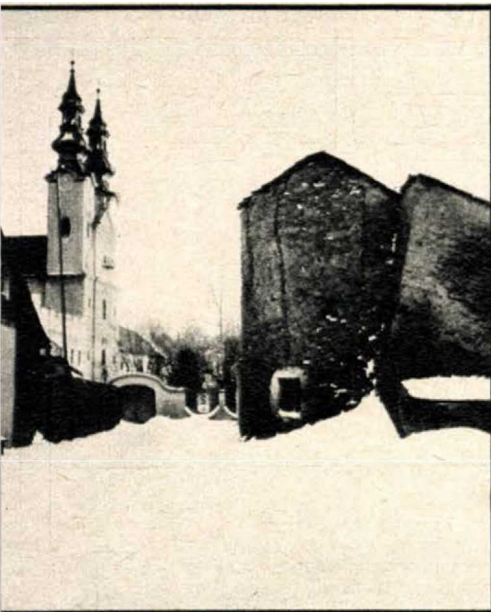
A legrégebbi városrész