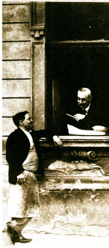
» Krúdy végre otthonra lett?