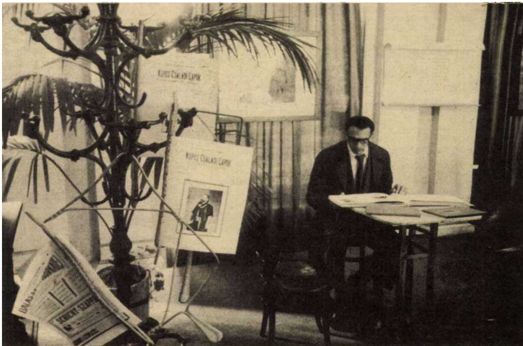
A kiállítás részlete.

valamint 1848-as csatajelenetet ábrázoló nagyítás a honvédkapitány nagypapa egésszalagos fényképével. A családi hagyományt idéző képek alatt biedermeier enteriőrt rendeztek be. Az asztalon díszes-kötésű, fiktív családi album, melyben Krúdy-vonatkozású fényképek talál a látogató. A szemközti falon színes festményreprodukciók sora utal a dualizmuskori Magyarország történelmére, társadalmára. A századforduló hangulatát egy kávéházi terasz eleveníti fel. A fogascon korabeli lapok fakszimiléi, a márványasztalon albumok, reggelizőkészlet látható, a terasz felett világosszínű túllüggöny ível át. A második terembe lépve Krúdy novelláinak világára utaló, hangulatos enteriőrök fogadják a látogatót. A korabeli tárgyak kissé ironikus hangsúllyal szerepelnek. A terem négy sarkában álfalakal körülvett, belső teret alakítottak ki, ezekben látjuk Majmunka szobáját, a Szindbádot — az utazásra mindig kész, nyitva tartott útiládaival, a valamely hölgy-