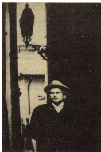
Latinovits Zoltán a Szindbád című filmben.

„Őszi utazások...” címmel. A kiállítás rendezői az adott tér kihasználása mellett olyan önálló belső térrendszert is kialakítottak, melyben Krúdy sajátos álmovilága hatásosan érvényesül. Az író és korát, valamint írásainak hangulatát bemutató kiállítás mind formailag, mind tartalmilag eltér a hagyományos irodalmi kiállítások rendszerétől. Az első teremben a falon Krúdy fiatalkori arcképe nyitja a tablósort. Mellette a Krúdy-címer és a családfa látható,